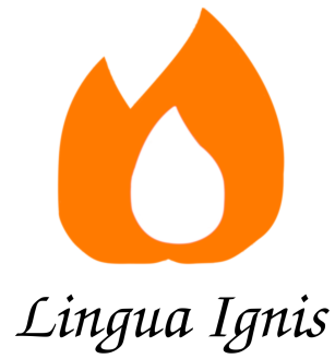
Figura 2: Logotipo oficial de Lingua Ignis .

a personas de varios países que se podrían beneficiar de un servicio como el nuestro. Habría que usar también colores más cálidos para transmitir calor, intimidad; un sentimiento de hogar.