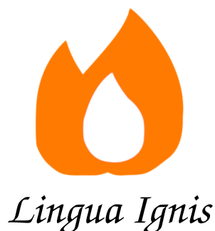
Figura 2: Logotipo oficial de Lingua Ignis .

a personas de varios países que se podrían beneficiar de un servicio como el nuestro. Habría que usar también colores más cálidos para transmitir calor, intimidad; un sentimiento de hogar.